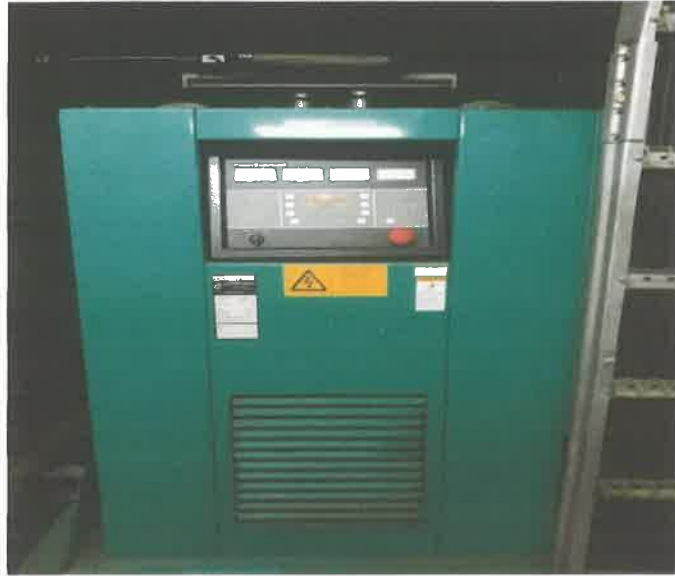
Commins รุ่น GST30G2 ประจำอาคาร กฝอ.กพร.